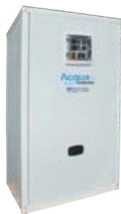
Unità idronica con Boiler separato e con volano termico incorporato (opz.) mod. WARC/WACRB