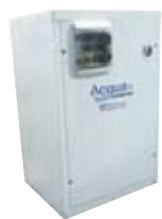
Unità compatta con boiler e volano termico separati mod. WMRC/WMCRB