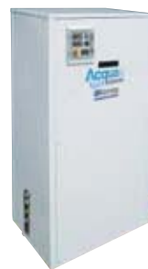
Unità Monoblocco con Boiler da 150/185 lt incorporato mod. WRHC