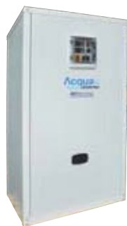
Acquainverter mod. WACRB con volano termico integrato 80 litri (opz.)