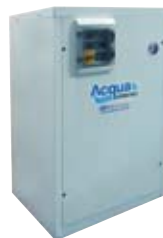
Acquainverter mod. WMCRB con volano termico esterno