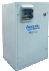
Acquainverter mod. WMRC con volano termico esterno