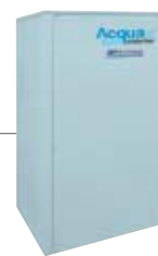
serbatoio sanitario mod. WB 110-150 110-150 litri