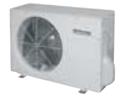
Unità esterna DC Inverter mod. COH

Acquainverter produce il riscaldamento tramite un sistema a pompa di calore trivalente DC inverter di tipo split-system che consente di regolare la temperatura dell'acqua calda da 30° a 50° C, fino a temperature esterne di -15° C. La distribuzione del riscaldamento e del raffreddamento può avvenire attraverso impianti radianti a bassa temperatura o ventilconvettori. Tutto questo grazie ad una serie di soluzioni progettuali e costruttive all'avanguardia. In particolare, la sofisticata gestione elettronica regola la potenza del compressore e i consumi di energia elettrica dal 15% al 100% in funzione delle esigenze di utilizzo e svolge l'autodiagnosi e i controlli climatici esterni per garantire sempre il massimo rendimento. Il bollitore ad alta stratificazione assicura inoltre l'erogazione continua di acqua calda fino all'80% della capacità del boiler, mentre il motore evaporante esterno - che integra l'elettronica DC Inverter e il compressore - opera in modo estremamente silenzioso. Infine, l'interfaccia del pannello di controllo è stata progettata in funzione della massima facilità di utilizzo, racchiudendo al proprio interno pochi semplici comandi per l'accensione, lo spegnimento, la gestione del riscaldamento-condizionamento e acqua calda sanitaria oltre ai termostati elettronici che informano istante per istante sulle condizioni di temperatura dell'acqua impianto e sanitario.