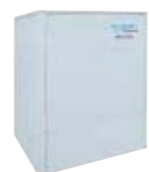
Volano Termico KIT impianto 60/80 lt