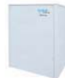
volano termico KIT impianto 60 litri