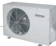
1 o 2 unità esterne COH2505D COH4501HE10 COH6001HE10