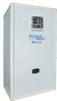
Acquainverter mod. WARC con volano termico integrato 80 litri (opz.)