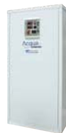
Modello WRHC07503/4HCS WRHC08001HCS WRHC16003/4HCS