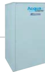
serbatoio sanitario mod. WB 110-150 110-150 litri