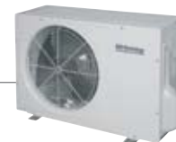
1 o 2 unità esterne COH2505D COH4501HE10 COH6001HE10